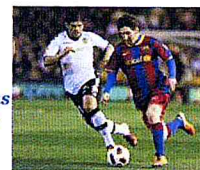
Messi apuntala al Barça en el liderato