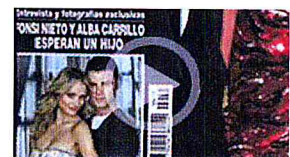
Fonsi Nieto va a ser padre